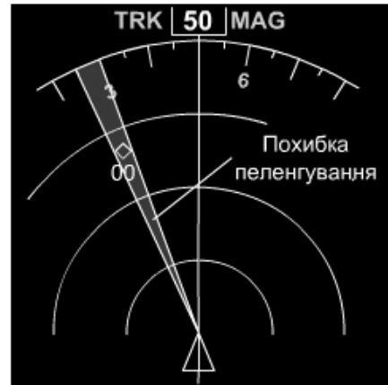
Рис.4 Похибка пеленгування

Наведені проблеми вказують на те, що маневри, розпочаті тільки за інформацією дисплею БСПЗ, мають знижену льотну безпеку. Пілоти не повинні намагатися самостійно вирішувати конфліктну ситуацію, використовуючи тільки інформацію з дисплею БСПЗ, а цілком покластися на алгоритми вирішення конфлікту БСПЗ і своєчасно виконувати рекомендації системи.