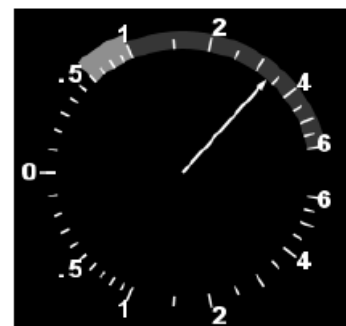
Рис.1 Інструкція БСПЗ на індикаторі вертикальної швидкості

Існує проблема сприйняття інструкції “Регулюй вертикальну швидкість” і пілот літака часто діє всупереч логіці БСПЗ[2]. Ця інструкція часто видається системою при зміні ешелону польоту і можливого початку конфлікту з іншим ПК. Вона направлена на зміну вертикальної швидкості ПК до швидкості, при якій конфліктна ситуація малоймовірна. Майже завжди ця інструкція передує більш вагомої інструкції „Набирай” чи „Знижуйся”. Тому правильна і