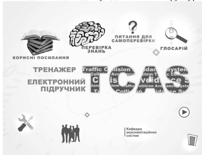
Рис. 1. Головне меню ЕНК

Головне меню ЕНК надає швидкий доступ до основних структурних елементів (рис.1).