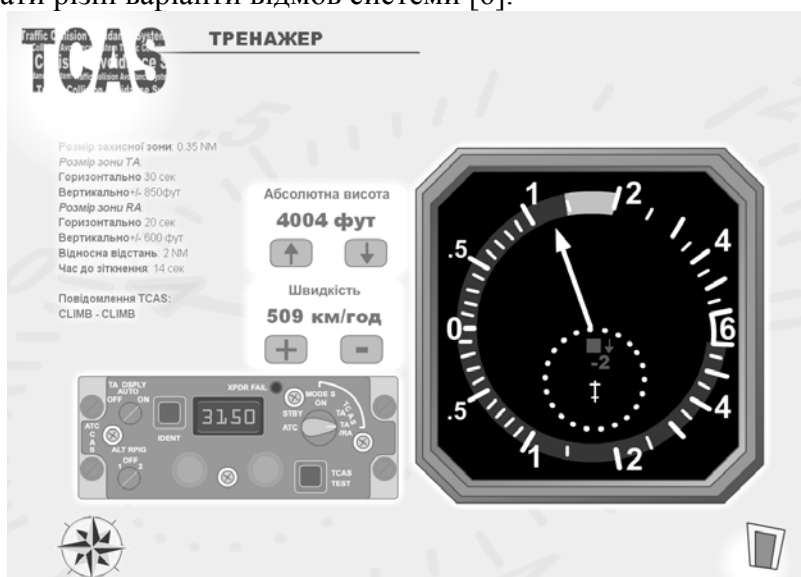
Рис.2. Електронний тренажер системи попередження зіткнень літаків

Модуль моделювання зустрічного повітряного руху відтворює простий сценарій конфліктної ситуації з вибором випадкової траєкторії руху, що дозволяє користувачу стикатися кожен раз з різною ситуацією та відпрацьовувати реакцію на різні повідомлення TCAS. Інтерактивний інтерфейс тренажера дозволяє набути навичок роботи з системою TCAS та відпрацювати різні варіанти відмов системи [6].